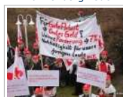
Kategorie: 1.100 Beschäftigte von K + S streiken in Göttingen