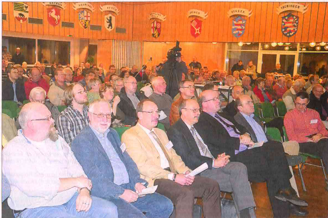
Blick in die voll besetzte Stadthalle während der 1. Generalversammlung

Die Gründung der BEG fand aufgrund des außergewöhnlichen Genossenschaftsmodells überregionale Beachtung. Die hessenweiten Radiostationen HR 1 und FFH berichteten. Ein Interview mit Prof. Dr. Hans Martin von Klaus Schaake in KasselZeitung -Online kann unter dem Link http://kassel-zeitung.de/cms1/index.php?/archives/12382-Wolfhager-Buerger-demokratisieren-Energiewende.html als Dauer-Podcast abgerufen werden. 4.4.2012, Iris Degenhardt-Meister